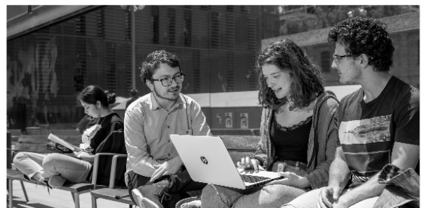
RECSM Winter Methods School (March 2024)

El beneficio se extiende a colegas de la misma institución de quien es asociado a WAPOR LATAM. El valor del descuento equivale a 3 cuotas anuales de la membresía a nuestro capítulo.